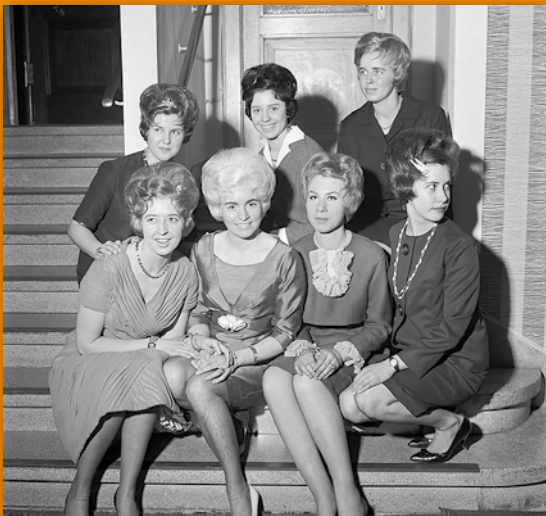
Strahlend präsentierten am 7. März diese jungen Damen im Hotel Kaiserhof die Frisurenmode der Friseur-Innung für Frühjahr und Sommer 1963. Neuer Modehit unter den Haartrachten war „Telstar“, benannt nach dem neuen Fernseh-Satelliten.

Über 80 Bilder der Pressefotografen Willi Hänscheid und Rudolf Krause zeigen aktuelle politische Ereignisse ebenso wie alltägliche Situationen und Veränderungen im Stadtbild, etwa durch Neubauten in der Innenstadt oder die Entstehung der Stadtteile Aaseestadt und Coerde. Alle Fotos sind mit informativen und spannenden Erläuterungen versehen. In einer Übersicht werden bedeutende weltpolitische Vorgänge den Ereignissen in Münster gegenübergestellt: eine Zeitreise in das Jahr 1963.