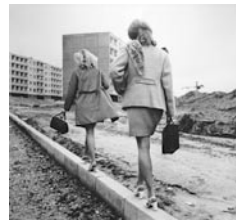
Der Beginn des Lazdynai-Distrikt, 1976