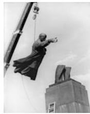
Auf Wiedersehen, Parteinossen, 1991