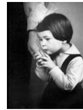
Mutters Hände, 1966