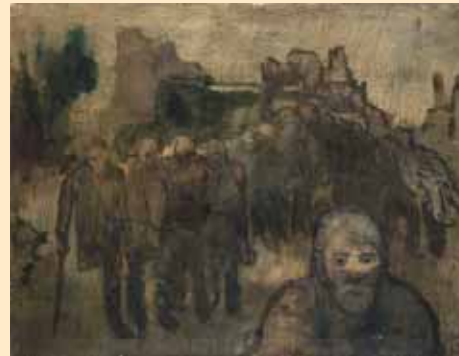
Heimkehr invalider Soldaten, 1946

Während des Krieges und in den Wirren nach Kriegsende hatte Carl Busch viele seiner Bilder verloren. Er machte sich daran – wie er selbst an einen Galeristen schrieb –, einen neuen Fundus zu ermalen, den er auf Ausstellungen präsentieren konnte. 1946 schuf er den aus vierzehn fast nur in grauen und braunen Tönen gehaltenen Bildern bestehenden Zyklus „Die Zeit“, in dem er den Krieg und die Nöte der unmittelbaren Nachkriegszeit schonungslos vor Augen führte. Als er ihn in Münster im „Kleinen Raum Clasing“ im August 1946 ausstellte, beschrieb die münste-