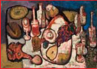
Stilleben mit Flaschen und Weintrauben, 1970

Experimente, Fingerübungen und weniger Gelingen – ist also Einblick in die Werkstatt. Und dieser Einblick ist gerade bei Carl Busch besonders aufschlussreich, einem Maler, der sich auf der Suche nach eigenen Ausdrucksformen auf sehr individuelle Art mit den Stilströmungen der Kunst des 20. Jahrhunderts auseinandersetzte.