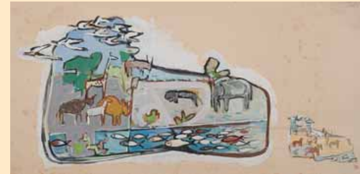
Entwurf für ein Wandbild, um 1955