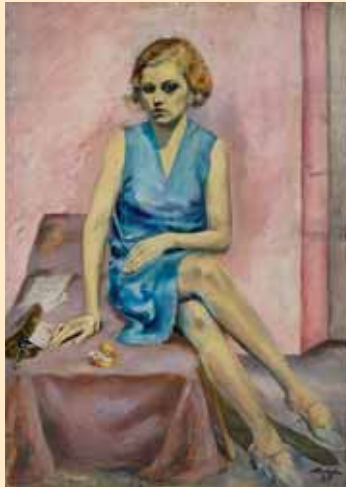
Junge Dame in blauem Kleid, 1926

Carl Busch wurde am 27. Juni 1905 in Münster geboren. Als Berufsausbildung absolvierte er eine Anstreicherlehre, die er mit der Gesellenprüfung abschloss. 1926 ging er als Bühnenmaler zum münsterischen Theater, das sich zu dieser Zeit in einer kurzen avantgardistischen Ära befand. Vielleicht hat dieses Klima dazu beigetragen, Carl Busch in seinem Wunsch zu bestärken, ein freischaffender Maler zu werden. 1929 mietete er sein erstes Atelier und wurde Mitglied der „Freien Künstlergemeinschaft Schanze“. Die beiden Selbstbildnisse von 1924 und 1929 dokumentieren diese Suche nach Identität und einem eigenen Stil: Aus dem schüchtern blickenden 19-Jährigen wird der lässige, selbstbewusste Künstler. Der Erfolg blieb nicht aus. 1933 wurde ihm der Jung-Westfalen-Preis verliehen. Viele weitere Auszeichnungen folgten in den nächsten Jahren. Da seine Kunst