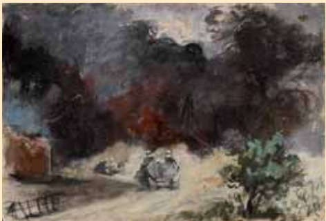
Raupenfahrzeuge, um 1942

in der 1986 von den Amerikanern an die Bundesrepublik Deutschland zurückgegebenen sogenannten „German War Art Collection“ befindet, die der Öffentlichkeit nicht zugänglich ist. Soweit diese Materialbasis eine Aussage zulässt, handelt es sich einerseits um nicht heroisierende Militärmalerei, die auch das Grauen des Krieges nicht völlig verschweigt, andererseits um ganz aus der Farbe heraus gestaltete Skizzen, die Licht- und Wettersituationen wiedergeben.