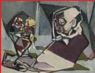
Mutter Busch mit Blumenvase, um 1957