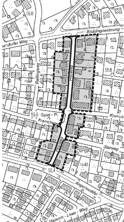
Übersichtsplan Nr. 2