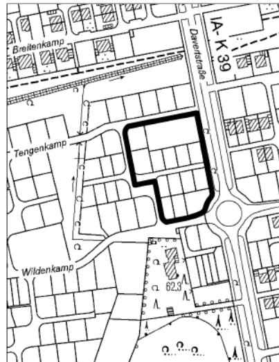
Übersichtsplan Nr. 2 Maßstab 1:5000 Abgrenzung des Bereiches der 1. Änderung des Bebauungsplanes Nr. 416