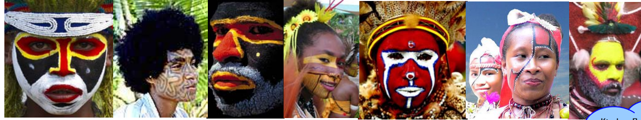
Traditionelle Gesichtsbemalung! für Erwachsene & Kinder: eine Auswahl traditionell bemalter Gesichter

Sport: Kleines Rugby Spiel (für Kinder & Erwachsene)