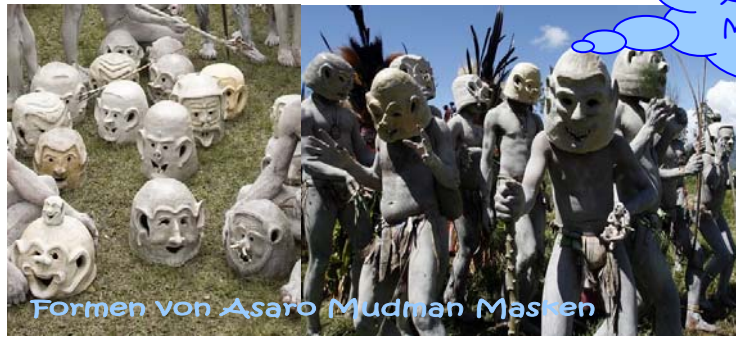
Formen von Asaro Mudman Masken

Kleine Stadtführung Samstag 9-13 Uhr für alle Interessenten! 5 Euro für Ticketkosten