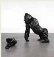
A. Fairhurst. A Couple of Differences between Thinking and Feeling II. 2003

„Sind die echt?“ werden viele fragen, wenn sie die Figuren von Lisa Büscher im Haus der Niederlande sehen. Früchte, Blumen, Menschen und Affen sind ihre Lieblingsthemen und die malt und formt sie solange, bis sie aussehen, als wären sie echt. Angus Fairhurst im LWL-Landesmuseum mag auch Affen. Denen sieht man aber an, dass sie nicht lebendig sind. Einem fehlt sogar ein Arm. Warum er den wohl verloren hat? Auf unserem Rundgang werden wir die Antwort finden. Die Rundgänge um 18.00 + 19.00 Uhr richten sich vor allem an Familien mit Kindern im Alter von 6–12 Jahren. 18.00 + 19.00 + 21.00 + 22.00 (Dauer: 1 Stunde)