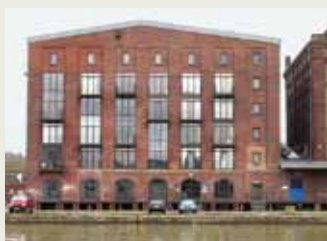
Speicher II am Hafen, Foto: Thomas Wrede

37 AZKM | 39 Atelieregemeinschaft Speicher II | 41 SO-66