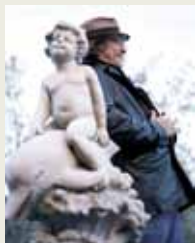
Helge Schneider.

16.00 + 18.00 + 20.00 + 22.00 (Dauer: 1 Stunde)