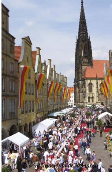
Día internacional de la Hansa