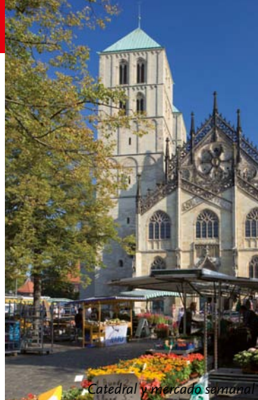
Catedral y mercado semanal

Castillo y Parque botánico – La otrora residencia del príncipe obispo, con sus fachadas bellamente adornadas por una profusión de figuras, fue edificada entre 1767 y 1787 como una construcción de tres alas por el arquitecto J.C. Schlaun. A la izquierda del edificio principal un pequeño portal con-