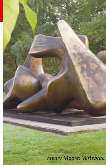
Henry Moore: Vertebrae

Y si lo que a usted le entusiasma es el lenguaje sin palabras de la música, que trasciende todas las fronteras, en Münster encontrará todo lo que está buscando, tanto si se trata de una velada ofrecida por la orquesta sinfónica de la