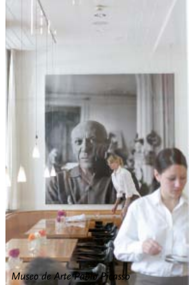
Museo de Arte Pablo Picasso

Biblioteca municipal (Stadtbücherei) – A la caprichosa elegancia del edificio doble de 1933 (creación del despacho de arquitectos Bolles-Wilson) se han añadido aquí con acierto ejes visuales y viales a la vez audaces y convincentes.