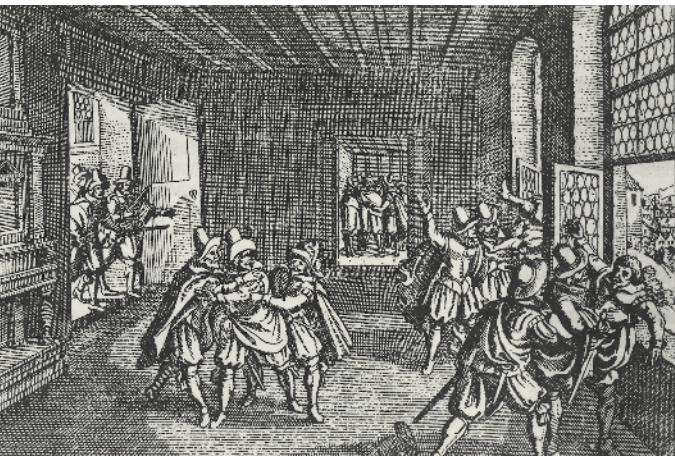
De Defenestratie van Praag, Stadtmuseum Münster

Directe aanleiding was de Defenestratie van Praag , waarbij Boheemse edelen de stadhouders van de katholieke koning Ferdinand II uit een raam van het kasteel in Praag gooiden. Toen vervolgens de calvinistische keurvorst Friedrich V von der Pfalz gekozen werd tot koning van Bohemen breidde het regionale conflict zich uit over het gehele Rijk.