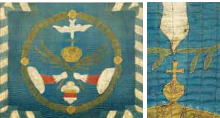
Gereconstrueerd: De Münsterse vredesvlag van 1648

Op initiatief van de Stadtheimatbund Münster is op een stuk stof een reconstructie vervaardigd die opnieuw de oorspronkelijke kleuren weergeeft. Op een blauwe achtergrond is een groene lauwerkrans afgebeeld die vier symbolen omvat: een witte duif met een groen takje in de bek, de Habsburgse gouden keizerskroon, twee handen in witte handschoenen die elkaar palmtakken als vredessymbolen overhandigen en het stadswapen van Münster in de kleuren goud, rood en zilver. De vredesvlag geldt als een icoon van de stadsgeschiedenis.