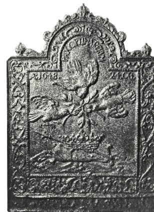
„Pax Optima Rerum“, haardplaat, Stadtmuseum Münster

Ter herinnering aan het sluiten van de vrede in 1648 bevindt zich in de schouw in de zuidelijke muur een gietijzeren kachelplaat van een meter hoog, die in het midden een kussen met kroon en scepter toont waarboven drie duiven met olijftak in de snavel te zien zijn. De inscriptie luidt: „Anno 1648. Pax optima rerum, 24 Oct.“ (Vrij vertaald: „Vrede is het hoogste goed, 24 oktober 1648.“)