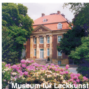
Museum für Lackkunst

Barrierefreier Eingang links neben der Hauptdrehtür, bitte hier klingeln. Aufzug. WC: UG.