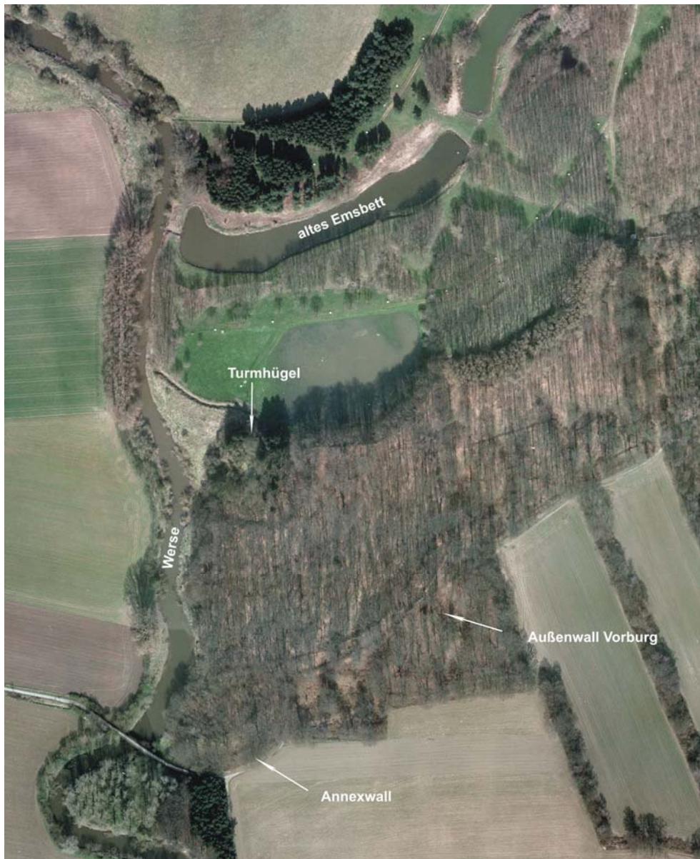
Haskenau: Luftbild (Stadt Münster, Vermessungs- und Katasteramt), März 2005

Die mittelalterliche Wallburg zeichnet sich nur schwach im Luftbild ab. Gut zu erkennen ist ihre Lage auf dem Hochufer der Werse, die hier früher in die Ems floss. In der Grundrisszeichnung ist die Wallanlage mit dem unmittelbar oberhalb von Werse und Ems gelegenen Turmhügel besser zu erkennen. Rot markiert sind die Hauptschadensstellen.