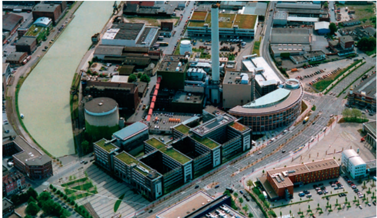
Luftaufnahme Stadtwerke und Stadthaus 3

Im August 1998 wurde das Stadtwerke-Gebäude eröffnet, das Stadthaus 3 folgte im Februar 2002. Das Gebäude der Stadtwerke Münster wurde in Kammstruktur mit zum Albersloher Weg hin installierten Glasmembranen erstellt. Das Gebäude Stadthaus 3 wurde als Kreissegment mit einer zum Heizkraftwerk gläsernen Veranstaltungshalle realisiert.