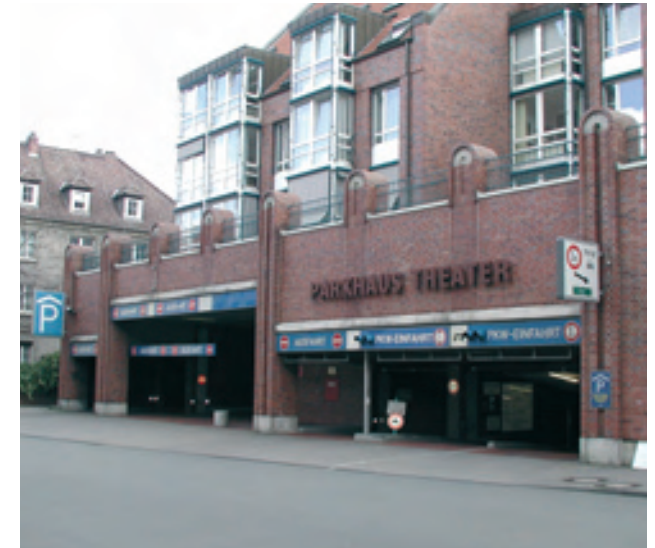
Einfahrt zum Parkhaus

Baubeginn war 1983 nach Plänen der Architekten Mirbach und Pries. Die Tiefgarage mit 800 Pkw - Einstell- und 12 Busparkplätzen wurde 1986, das Altenwohnstift 1992 fertiggestellt.