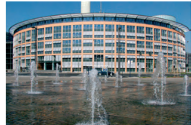
Ansicht Stadthaus 3