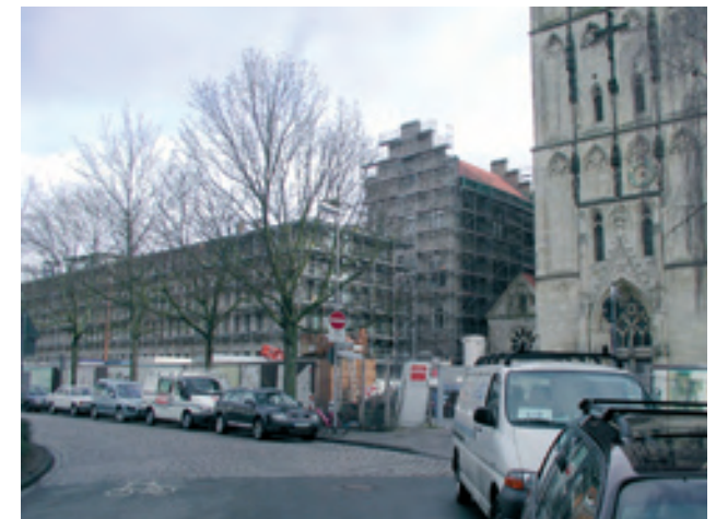
Wettbewerbsentwurf (1. Preis) und Realisierung