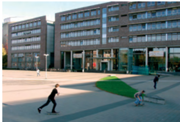
Ansicht Stadtwerke, Hafenplatz